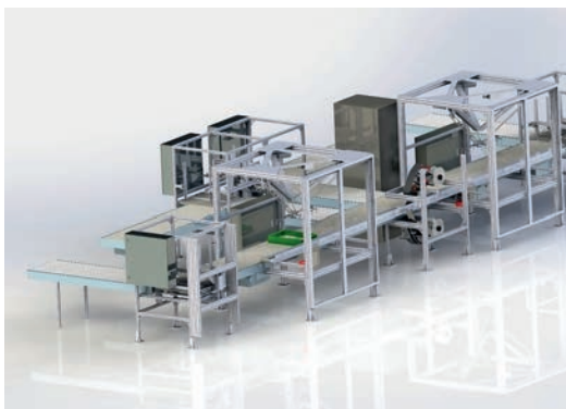
Die innovative, vollautomatische Etikettieranlage (Zeichnung).